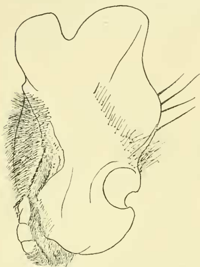
Synterogomphus sternbergi subgen. nov., spec. nov. Fig. 1. Rechter Oberkiefer von unten.

darauf folgt alleinstehend ein etwas schlanker Zahn, während die drei letzten wiederum in einer schrägen Linie angeordnet sind. Unterlippe und Taster zeigen keinerlei